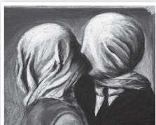
Los amantes, de René Magritte