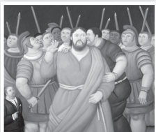
El beso de Judas, de Fernando Botero