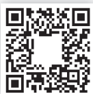
El arte de pasar de todo

b. Prestá atención a los tráilers de estas películas.