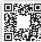
Las ventajas de ser invisible