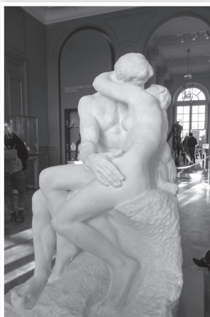
El beso, escultura de Auguste Rodin