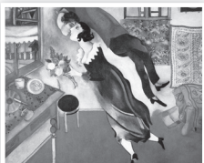
El cumpleaños, de Marc Chagall

a. En pequeños grupos, miren estas obras de arte dedicadas al beso.